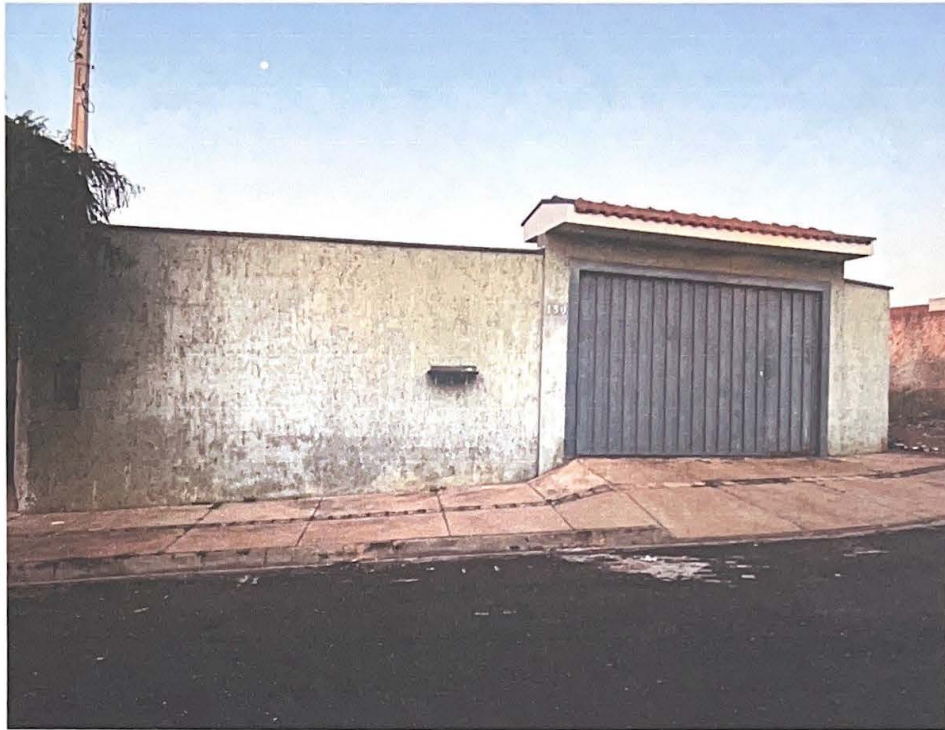
Fachada do imóvel

Na mesma quadra ou lote e os outros empreendimentos de lotes e unidades no mesmo bairro e imóveis se não vendidos na região, bem como a tabela atualizada para no bairro em valor de metro quadrado.