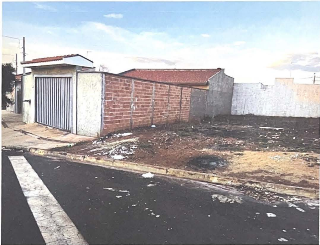
Imagem lateral do imóvel, facilitando ver a parte construída.